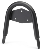
Rám opěrky spolujezdce pro model XV950