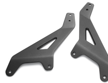
Boční držáky opěrky spolujezdce pro model XV950