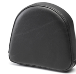
Vycpávky opěrky spolujezdce XV950